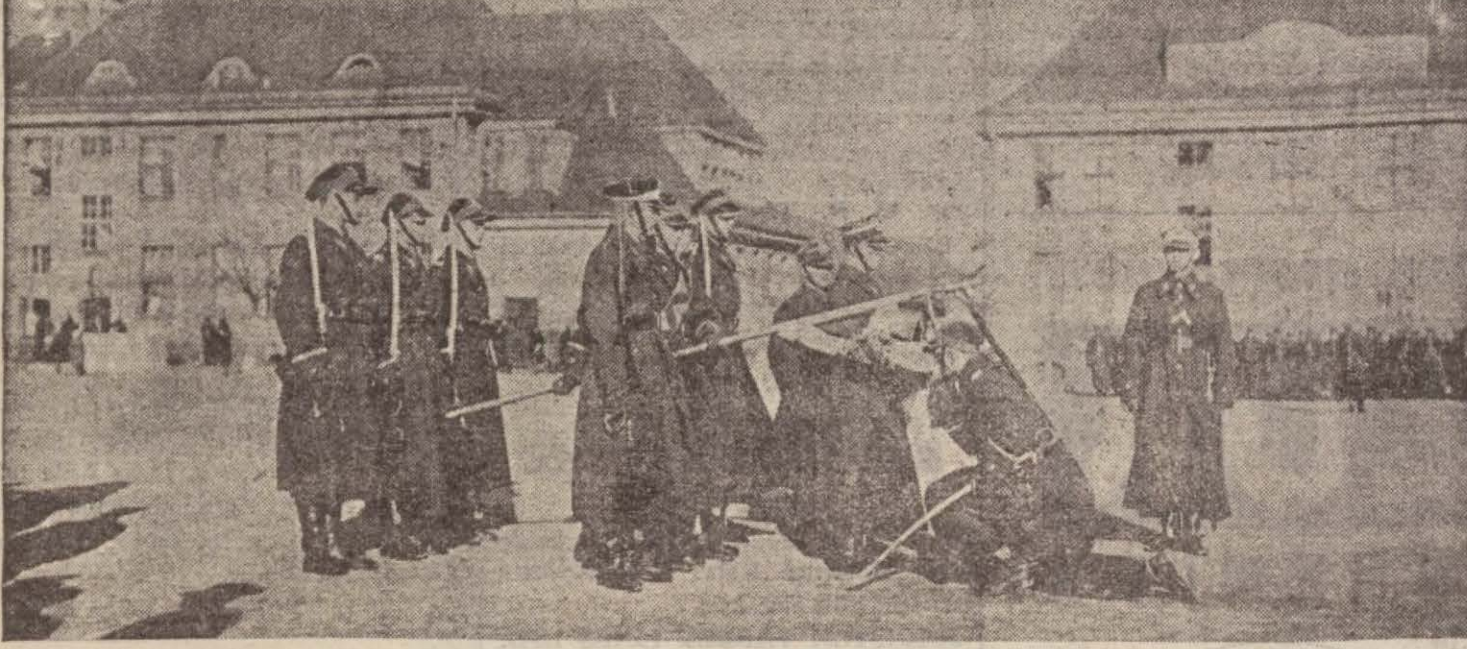
Varşovada bir sancak töreni

"Polonya lüzumlu dakika gelince vaziyete hâkim olmağı bilecektir,"