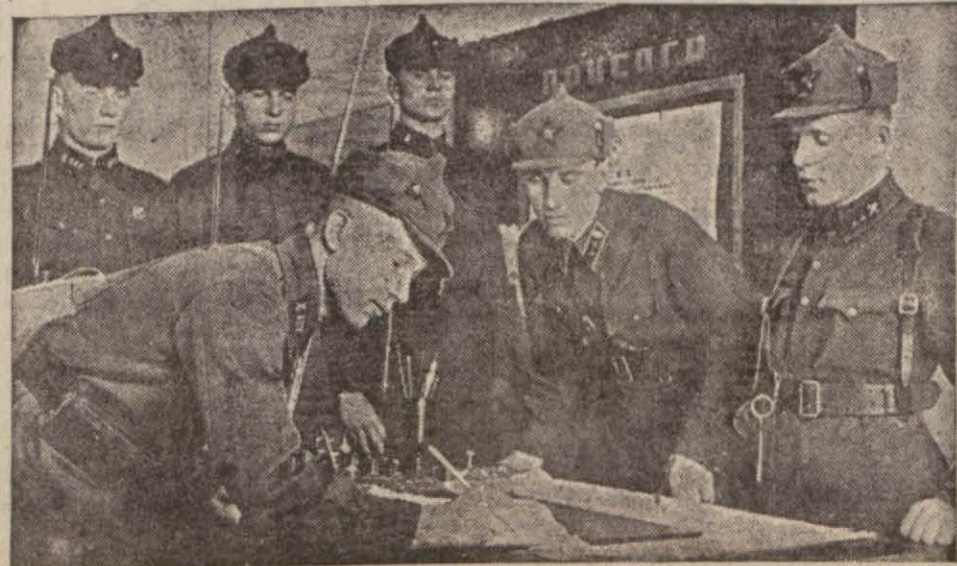
Sovyetlerin genç subayları bir çalışma esnasında

LONDRA, 26 (Ö.R.) — B. Çemberlayın, İngiliz - Rus müzakerelerinin cereyanı hakkında, Avam Kamarasında yaptığı beyanat metninin Moskova hükümetine tebliğinden 24 saat sonra, İngiliz hükümeti Rusyanın sulh cephesine iltihakı hakkında hazırladığı pakt profesini de Moskova'ya bildirmiştir. Londrada kaydedildiğine göre, Rusya ile müzakereler hakkında, son günler zarfında İngiliz ve Fransız kabineleri arasında sıkı temas hiç bir ân kesilmemiş ve en tam bir fikir birliğinin tezahürüne vesile olmuştur. Diğer taraftan bir çok hükümetler, eztimele Varşova ve Bükreş hükümetleri müzakerelerin cereyanından haberdar edilmişlerdir. Başvekil B. Nevil Çemberlayın Amerika sefirine bu hususta bizzat izahatı bildirmiş ve İngilterenin niyetlerini hükümet-