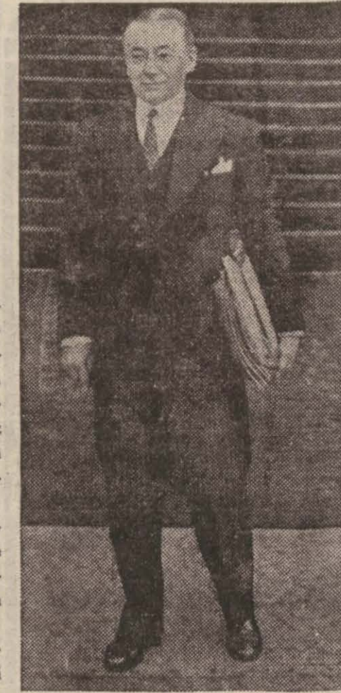
Fransız Maliye nazırı Reynö

Fransa hariçten bir çok kısa vâdeli borç akdetmiştir ki bunların 5, 6, tarihi ile önümüzdeki 29/2, tarihi arasında gelecek olan toplanmış vâdeleri memleketi harp hazinesi aleyhine altı milyar altın tediyesine mecbur edecektir. Bu tehlike