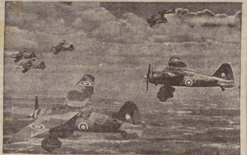
İngiliz harp tayyarelerinin manevraları

«Maksadımız dünyayı harbin dehşetinden korumak ve sulhu muhafaza etmektir.»